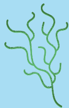
김녕, 월정리 톳