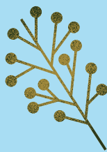
성산, 우도 모자반