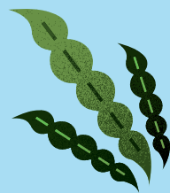
한림, 협재 다시마

해심차 티백 세트는 제주 바다를 대표하는 '다시마, 감태, 톳, 모자반'을 모티프로 선정하고, 이를 그래픽 형식으로 단순화하여 도형적으로 표현했습니다.