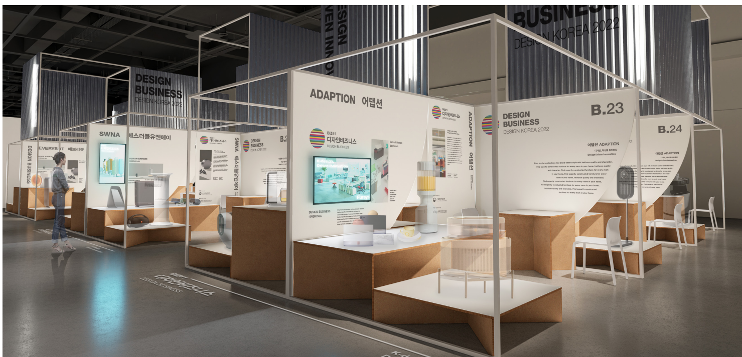
오프라인 플랫폼 Offline Platform: 2022. 11. 23. (Wed.) – 11. 27. (Sun.) 서울 양재 aT 센터 Seoul Yangjae aT Center