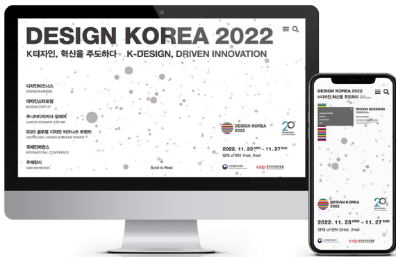
온라인 플랫폼 Online Platform: 2022. 06. 30. (Thu.) – 12. 31. (Sat.) designkorea.kidp.or.kr